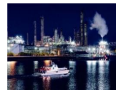
ものづくり産業を支える四日市コンビナート