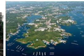
伊勢志摩国立公園 (G7伊勢志摩サミット、G7交通大臣会合開催地)