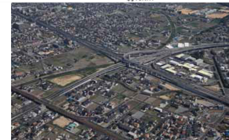
《ものづくりを支える道路網(加古川中央ジャンクション)》