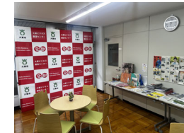
《大東ビジネス創造センター》