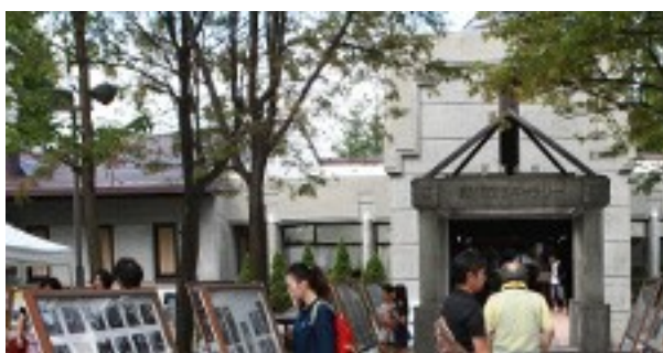
国際写真フェスティバル

これらの観光資源を活かして、観光入込客数の増加を加速させ、地域経済に波及効果が高い観光に関する事業を推進する。