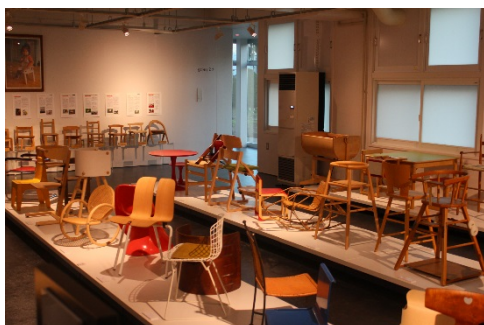
デザイン家具コレクション