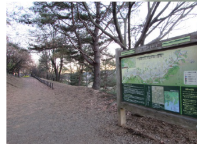
歴史の道100選に認定された「多摩よこやまの道」