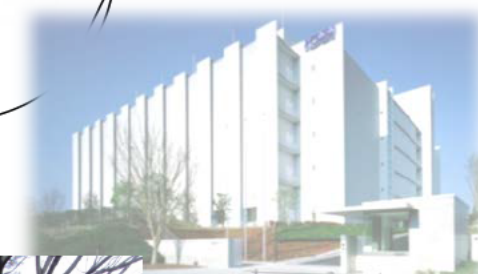
立地企業イメージ