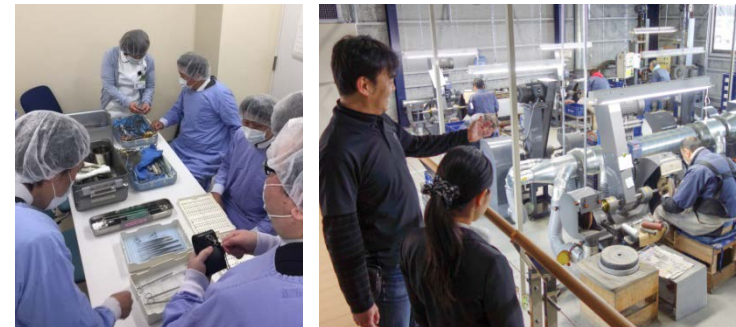
燕市医療機器研究会の活動