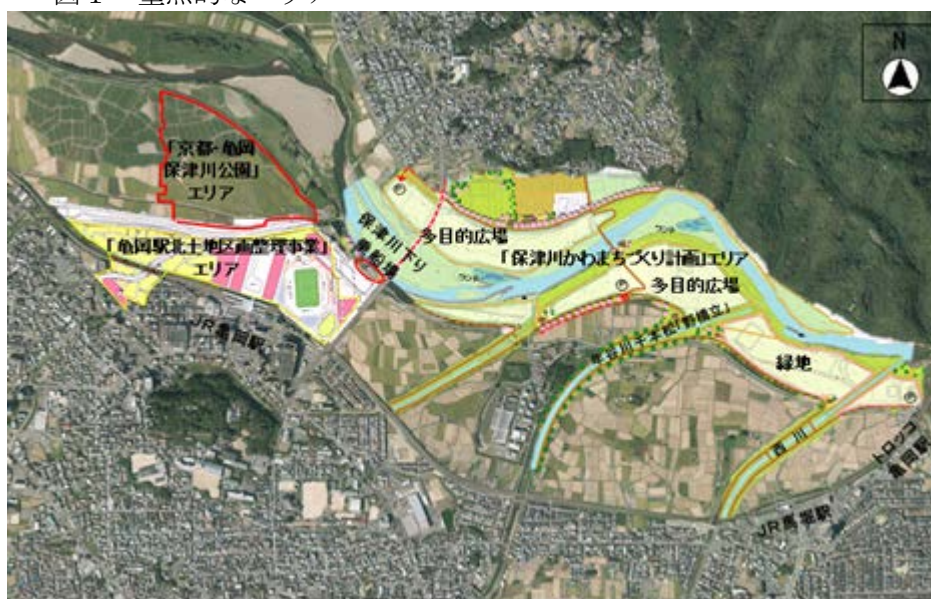
図 1 重点的なエリア

このため、本促進区域の中でも、特に図 1 に示した「亀岡駅北土地区画整理事業」エリア、「京都・亀岡保津川公園」エリア、桂川改修で生じた高水敷等の「保津川かわまちづくり計画」エリア等において、これらのエリアの地域特性が最大限発揮されるよう基盤づくりを進める。まず、土地区画整理事業地内の京都スタジアムにおいては、国際試合や日本プロサッカーリーグ等によるスポーツ興行の開催や年間を通じた多様なイベントの開催による交流人口の拡大に取り組み、さらに、複合機能化したスタジアムと土地区画整理事業地に誘致される商業施設との連携や双方向の多角的な利用を図っていく。また、亀岡市が、天然記念物アユモドキの保全と環境教育や体験学習の場として活用する都市公園を整備するとともに、京都府と亀岡市が連携して、図 1 のエリア内でアユモドキの総合的・広域的な保全対策等を実施し、新たな地域観光資源として展開する。これらの取組に加え、既存の観光資源とのネットワークを強化し、入込客の滞留時間を伸ばすため、京都スタジアムを含む上記のエリア全体を利活用した「スポーツ・観光・まちづくり」事業を推進することにより、京都市域を訪れる観光客や国際旅客港として機能強化を進める舞鶴港からの外国人旅行者等を取り込み、入込客等を市場とする小売業、宿泊業、飲食サービス業などの雇用の創出と観光消費の拡大を図る。また、新しいまちの機能を高度化するため ICT 化に取り組み、それにより得られたビッグデータを公開し、そのデータを活用した新たな観光ビジネス等の創出で好循環を目指す。