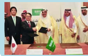
議事録署名の様子