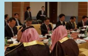
閣僚級会合の風景