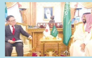
ムハンマド副皇太子表敬