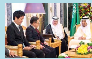
サルマン国王表敬