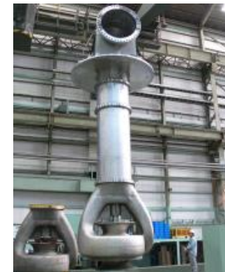
海水淡水化用ポンプ