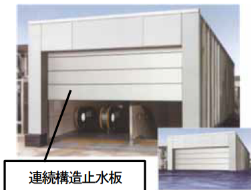
写真1 シャッター型設置例

これらの浸水防止用設備のうち、建具型（シャッター及びドア）と呼ばれる製品については、所有者・管理者が設置場所に適した浸水防止用設備を選択し、製品の比較が可能となるよう JIS で品質基準を規定しました。