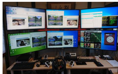
遠隔監視・操作室