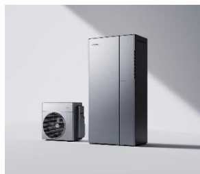
ハイブリッド給湯機