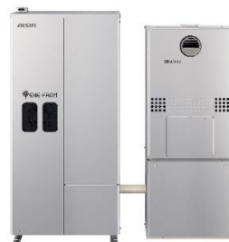
家庭用燃料電池（エネファーム）