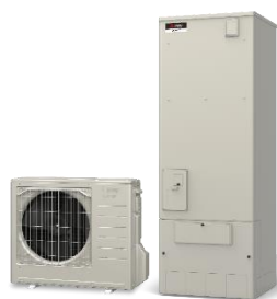
ヒートポンプ給湯機（エコキュート）