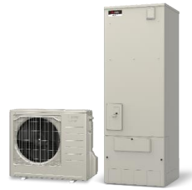
ヒートポンプ給湯機（エコキュート）

※高効率給湯器の導入と併せて蓄熱暖房機または電気温水器を撤去する場合、加算補助。