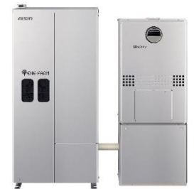
家庭用燃料電池（エネファーム）