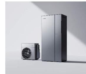
ハイブリッド給湯機