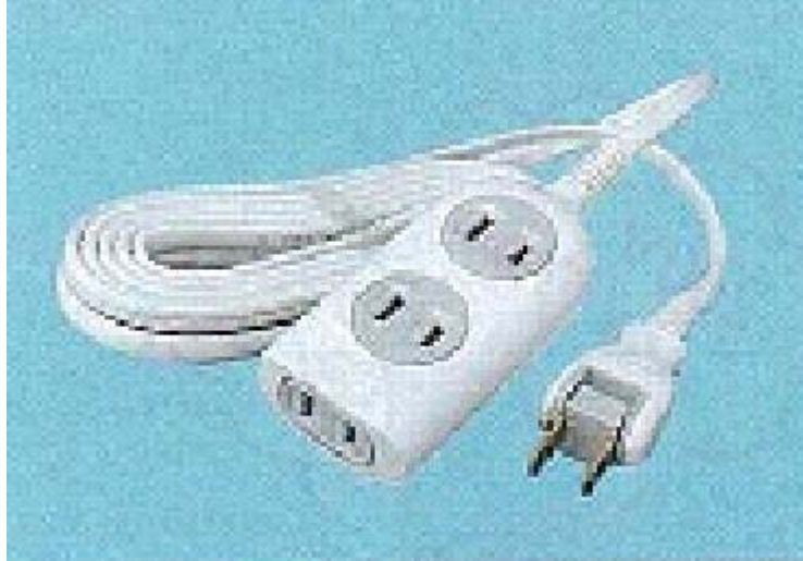
テーブルタップ (管理番号 : A201200719)