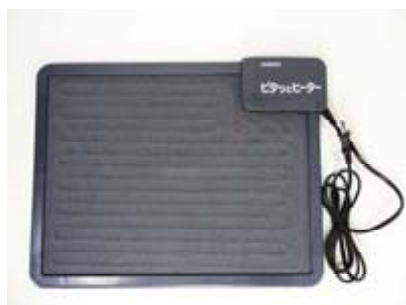
ピタッとヒーター（NN8920）