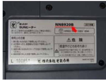
暖ったかSUNヒーター (NN8920B)