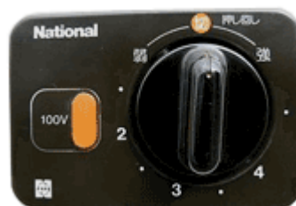
スイッチ部の外観