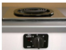
一口こんろ(前面操作) ※写真は富士工業製

身体や物が接触し、意図せずスイッチが「入」となる可能性がある構造であったために、電気こんろの上や周囲に可燃物が置かれていて、火災事故に至る危険性があります。