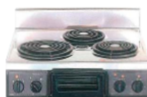
複数口こんろ(前面操作のみ)