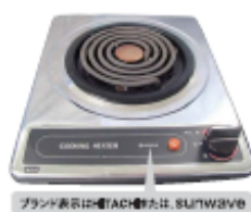
一口こんろ(上面操作) ブランド表示は「HACH」または「SUNWAVE」