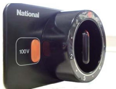
改修後：カバー付き