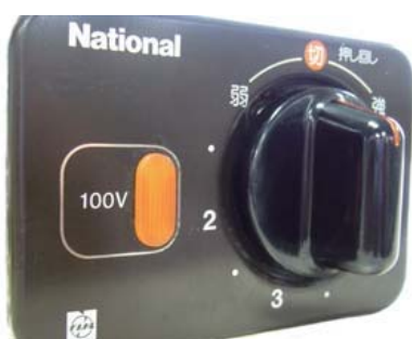
改修前：カバー無し