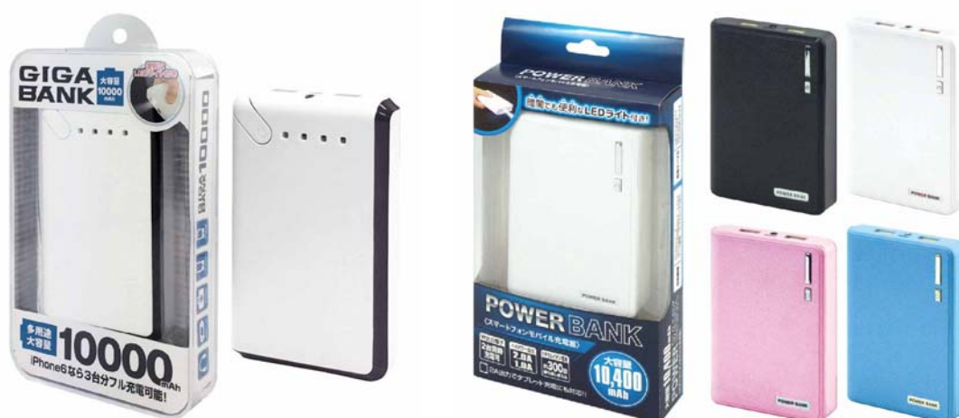
ギガバンク 10000mAh (HAC1078)