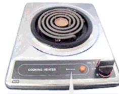
一口こんろ (上面操作) ブランド表示はHITACHIまたは、SUNWAVE