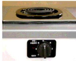
一口こんろ (前面操作) ※写真は富士工業製

身体や物が接触し、意図せずスイッチが「入」となる可能性がある構造であったために、電気こんろの上や周囲に可燃物が置かれていて、火災事故に至る危険性があります。