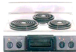
複数口こんろ (前面操作のみ)