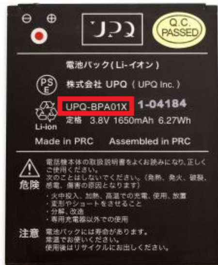
対策済品のバッテリーパック