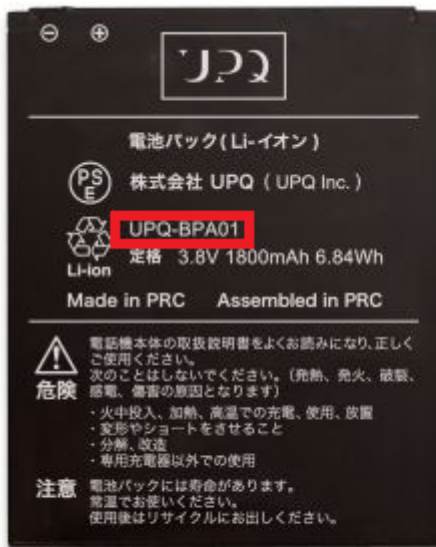
未対策品のバッテリーパック