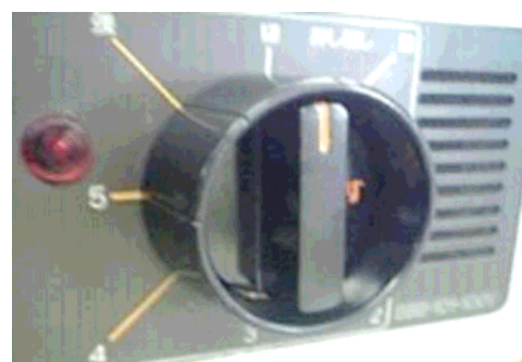
改修後：カバー付き