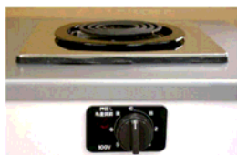
一口こんろ(前面操作) ※写真は富士工業製

身体や物が接触し、意図せずスイッチが「入」となる可能性がある構造であったために、電気こんろの上や周囲に可燃物が置かれていて、火災事故に至る危険性があります。