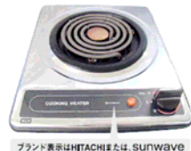
一口こんろ(上面操作) ブランド表示はHITACHIまたは、SUNWAVE