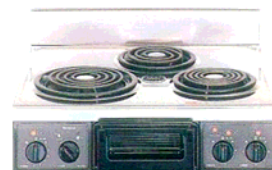
複数口こんろ(前面操作のみ)