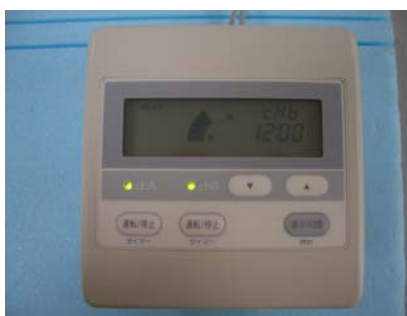
2回路用コントローラ