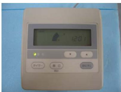
1回路用コントローラ