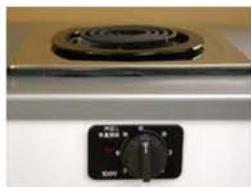
一口こんろ(前面操作) ※写真は富士工業製

身体や物が接触し、意図せずスイッチが「入」となる可能性がある構造であったために、電気こんろの上や周囲に可燃物が置かれていて、火災事故に至る危険性があります。