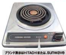
一口こんろ(上面操作) ブランド表示はHITACHIまたはSUNWAVE