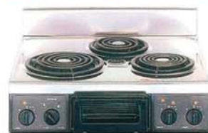
複数口こんろ(前面操作のみ)