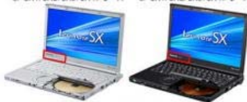
CF-SX1/SX2/SX3/SX4シリーズ CF-SX1/SX2/SX3/SX4シリーズ

Panasonic CF-SX1/SX2/SX3/SX4 または Panasonic CF-NX1/NX2/NX3/NX4