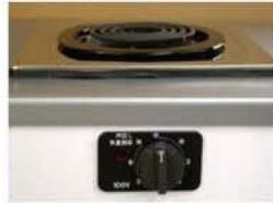
一口こんろ(前面操作)※写真は富士工業製

身体や物が接触し、意図せずスイッチが「入」となる可能性がある構造であったために、電気こんろの上や周囲に可燃物が置かれていて、火災事故に至る危険性があります。