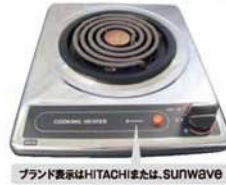
一口こんろ(上面操作)