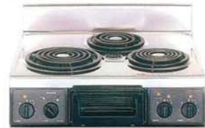
複数口こんろ(前面操作のみ)