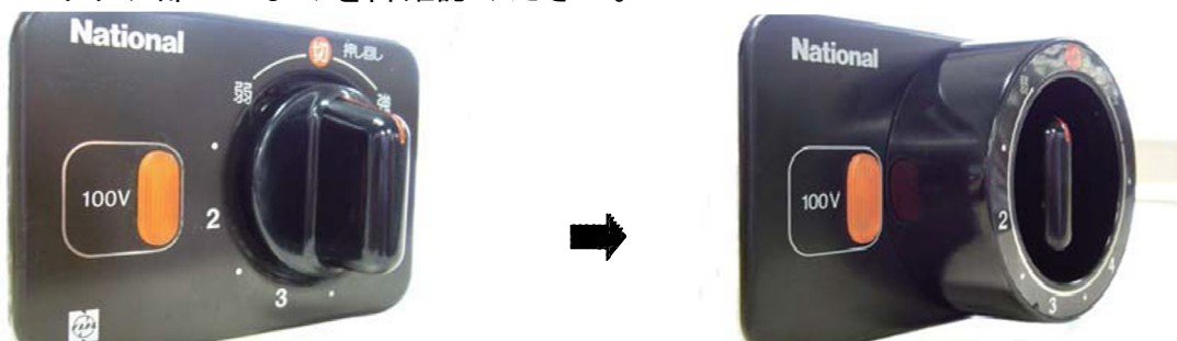
改修前：カバーなし