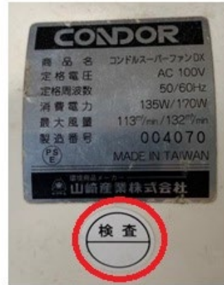
コンデンサー交換及び 他の部品の修理を実施した場合