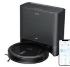
Eufy Clean G40 Hybrid+ カラー：ブラック