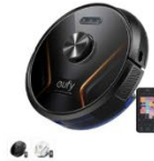
Eufy RoboVac X8 Hybrid カラー：ブラック、ホワイト