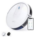
Eufy RoboVac 15C カラー：ホワイト、ブラック

https://www.ankerjapan.com/pages/robovac-support