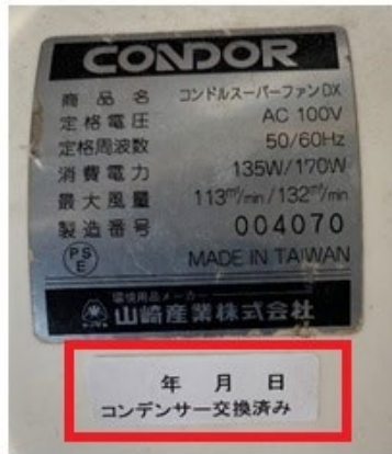
コンデンサー交換のみ 実施した場合

コンデンサー交換のみ実施した場合は「コンデンサー交換済み」シールを、コンデンサー交換及び他の部品の修理を実施した場合は「検査」シールを、それぞれ日付を記入の上、銘板に貼付します。