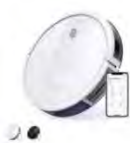
Eufy RoboVac 15C カラー：ホワイト、ブラック

https://www.ankerjapan.com/pages/robovac-support