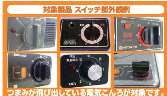
対象製品 スイッチ部外観例