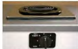
一口こまろ(前面操作)※写真は富士工業製

身体や物が接触し、意図せずスイッチが「入」となる可能性がある構造であったために、電気こまろの上や周囲に可燃物が置かれていて、火災事故に至る危険性があります。