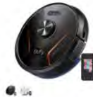
Eufy RoboVac X8 Hybrid カラー：ブラック、ホワイト