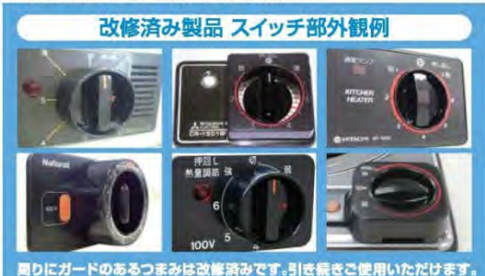
改修済み製品 スイッチ部外観例