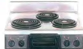
複数口こまろ(前面操作のみ)