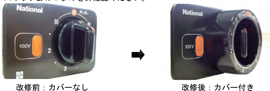
改修前：カバーなし