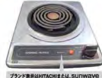
一口こまろ(上面操作) ブランド表示はHITACHIまたはSUNWAVE