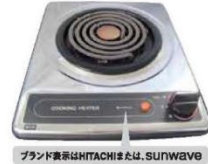
一口こまろ(上面操作) ブランド表示はHITACHIまたはSUNWAVE