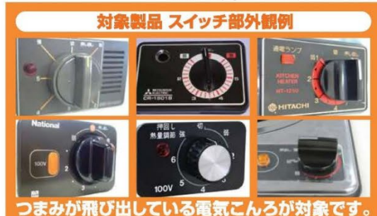
対象製品 スイッチ部外観例