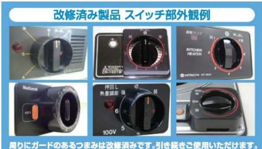
改修済み製品 スイッチ部外観例