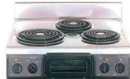
複数口こまろ(前面操作のみ)