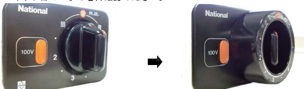
改修前：カバーなし