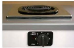
一口こまろ(前面操作)※写真は富士工業製

身体や物が接触し、意図せずスイッチが「入」となる可能性がある構造であったために、電気こまろの上や周囲に可燃物が置かれていて、火災事故に至る危険性があります。