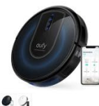
Eufy RoboVac G30 カラー：ホワイト、ブラック