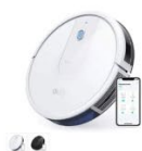
Eufy RoboVac 15C カラー：ホワイト、ブラック

https://www.ankerjapan.com/pages/robovac-support