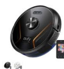
Eufy RoboVac X8 Hybrid カラー：ブラック、ホワイト