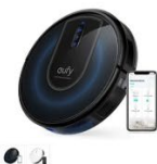
Eufy RoboVac G30 カラー：ホワイト、ブラック