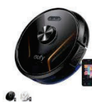
Eufy RoboVac X8 Hybrid カラー：ブラック、ホワイト