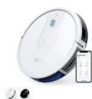
Eufy RoboVac 15C カラー：ホワイト、ブラック

https://www.ankerjapan.com/pages/robovac-support