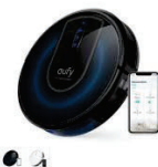
Eufy RoboVac G30 カラー：ホワイト、ブラック