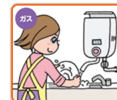
屋内式ガス瞬間湯沸器 (都市ガス用/プロパンガス用)