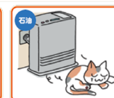
FF式石油温風暖房機