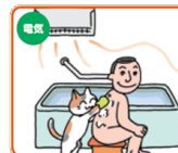
浴室用電気乾燥機