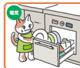
ビルトイン式電気食器洗機