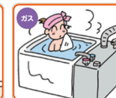
屋内式ガスふろがま (都市ガス用/プロパンガス用)