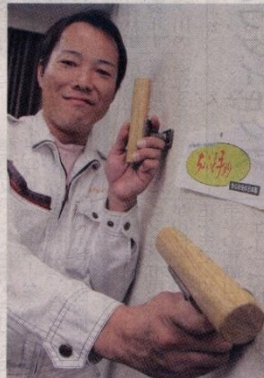
ちょっとした場所に便利な手すり

の発目にして、一気に商品化へと前進した。追究したのは、程よい長さ。つかみ心地や滑りにくささを考え、試行錯誤を繰り返した結果、長さは15センチ、安心安全の日本製で、縦の2タイプを考案。80°の重さに耐えられる強度を確保した。大掛かりな工事が必要なく、その名の通り「ちよこっと」取り付けられるので便利。