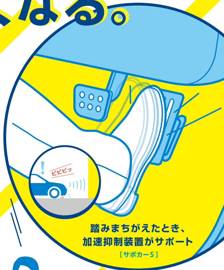
踏みまちがえたとき、 加速抑制装置がサポート [サポカー-S]