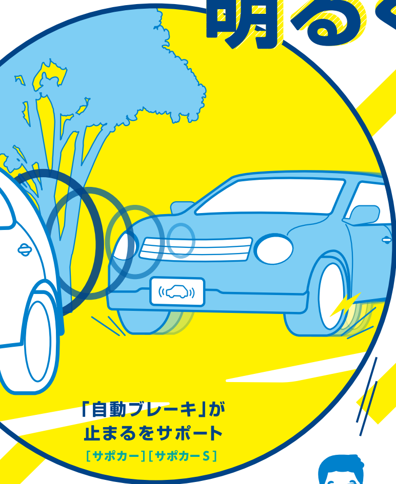
「自動ブレーキ」が 止まるをサポート [サポカー][サポカー-S]