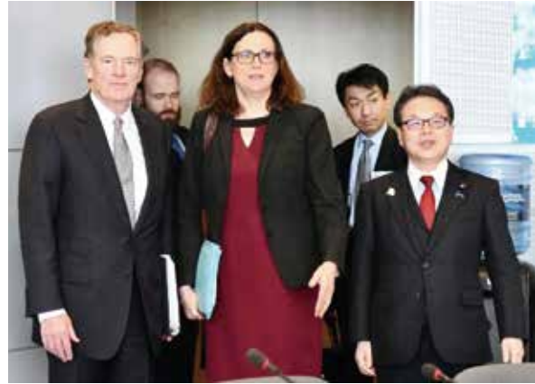
コラム第11-2図 第5回三極貿易大臣会合