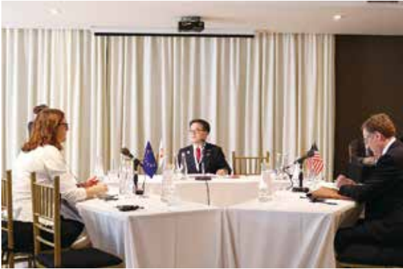
コラム第11-1図 第1回三極貿易大臣会合