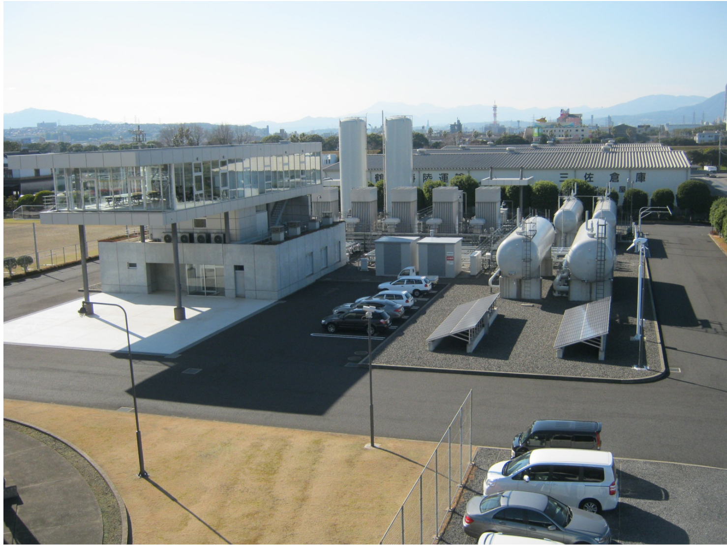
弊社大分工場(大分市三佐)