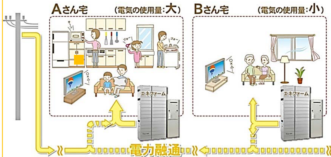
T-グリッドシステムイメージ図

* 住居やマンション内の空調や照明・換気等を運転管理することによってエネルギー消費量の削減を図る仕組み