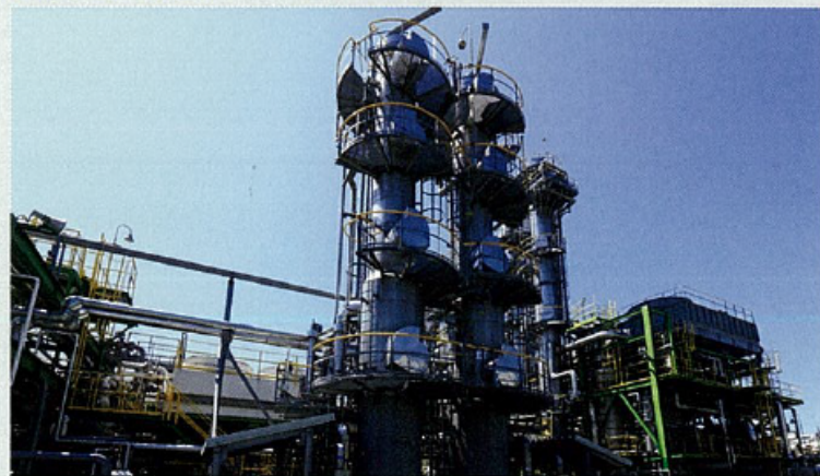
南長岡ガス田 [新潟県] 越路原/親沢プラント