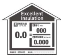
図：優良断熱材認証制度による優良断熱材認証マーク

一般社団法人 日本建材・住宅設備産業協会では、断熱材の断熱性能について第三者認証を行う「優良断熱材認証制度」を策定し、運用している（認証の有効期間：3年）。