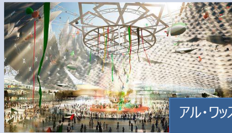
アル・ワッスル・プラザ (中央広場)

参加国 : 192カ国が参加表明済み。 会場面積 : 438ha、過去最大級の規模。 想定来場者 : 約2,500万人 (見込)