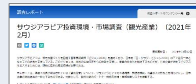
ジェトロ・ウェブサイトにて公開中