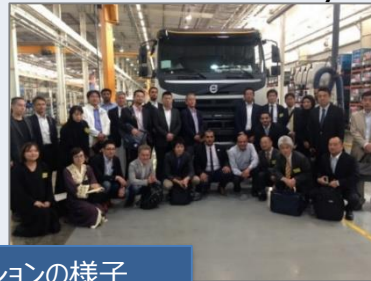
ミッションの様子

主な訪問先：MODON（サウジ工業用地公団）、 KAEC（King Abdullah Economic City） 他