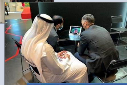
オンライン商談の様子