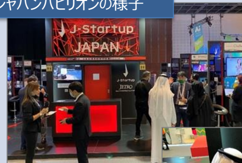
ジャパンパビリオンの様子