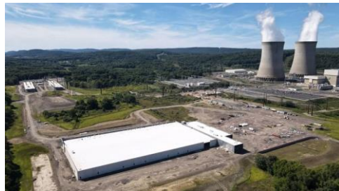
サスケハナ原子力発電所と隣接するデータセンター