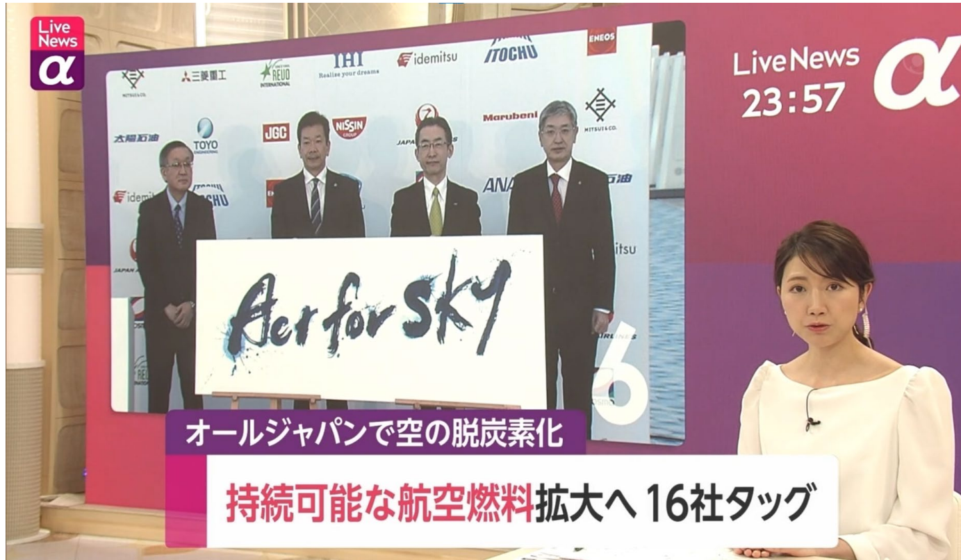
設立会見の報道の様子