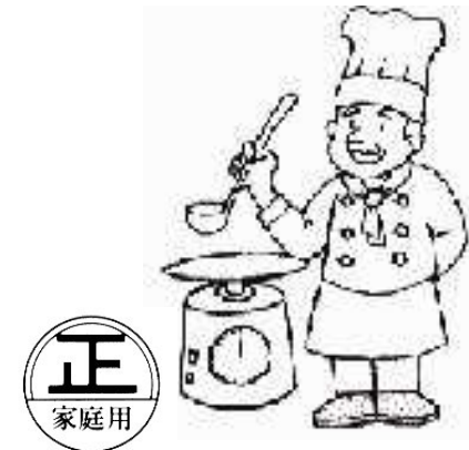
キッチンスケール