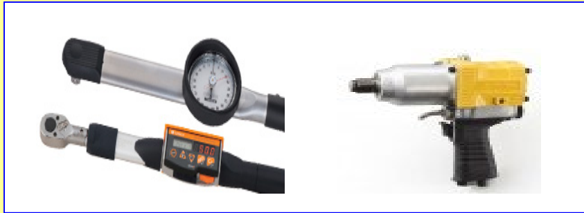
(工具類) トルクレンチ