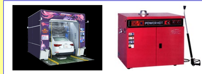
(洗浄機器類) 門形洗車機