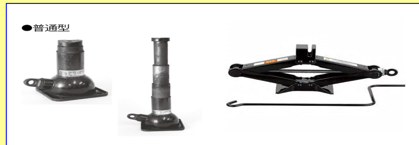
(携行式ジャッキ類) ねじ式ジャッキ