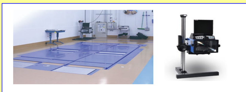
(試験機器類) ブレーキ・速度計複合試験器