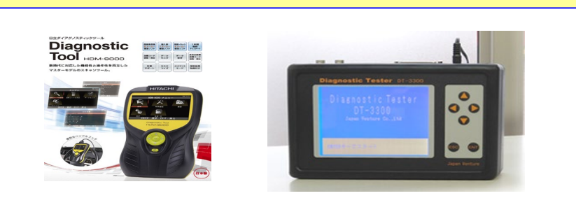
(電気機器類) スキャンツール(故障診断装置)