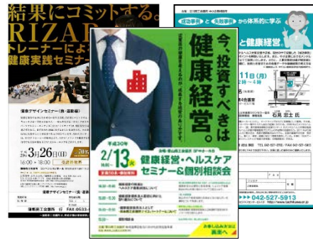
バラエティに富んだセミナー・講演会

会員企業向けに健康経営や従業員の健康づくりに関するセミナーを実施。これまで、大学教授や管理栄養士等の専門家が登壇することが多かったが、昨今では健康経営優良法人の認定を受けた企業の経営者や人事担当者が登壇するケースが増えている。