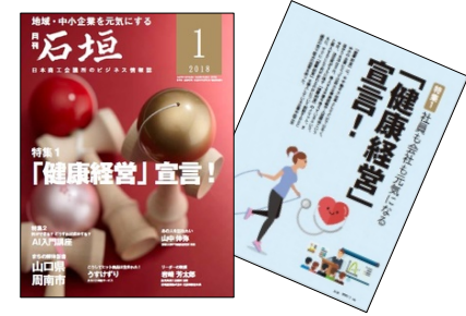
健康経営を特集した月刊「石垣」平成30年1月号

日本商工会議所が発行している情報誌「石垣」や「会議所ニュース」をはじめとする、各地商工会議所発行の会報や新聞、メルマガ等の媒体で健康経営に関する情報提供を行っている。