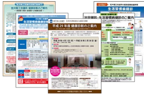
各地で実施されている様々な健康診断

会員企業の事業主、従業員、そのご家族の方の健康管理を目的として、健診機関と提携し、労働安全衛生法に定められた定期健康診断や、生活習慣病健診、腹部・胃部の専門健診等の各種健診を実施。