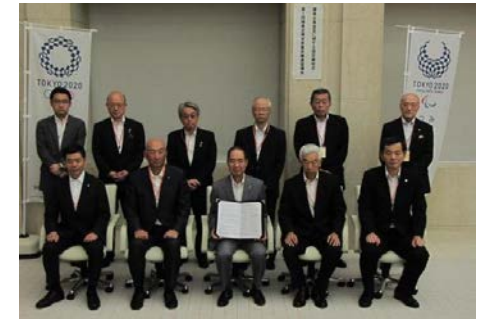
東京都商工会議所連合会、協会けんぽ、健康保険組合連合会等、13団体による協定を締結

北海道、青森、岩手、福島、栃木、群馬、千葉、東京、 新潟、富山、石川、滋賀、鳥取、島根、岡山、広島、 徳島、香川、愛媛、高知、熊本、宮崎