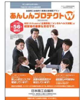
日商の保険制度で保険料を減免

日本商工会議所が東京海上日動火災保険株式会社と包括契約し、全国の商工会議所会員が割安な掛金で加入できる団体保険。従業員が被った業務上の災害をカバーする「業務災害総合保険」において、「健康経営優良法人」の認定を受けた法人に対して、2017年4月1日開始契約より5%の割引（健康経営優良法人認定割引）を適用。