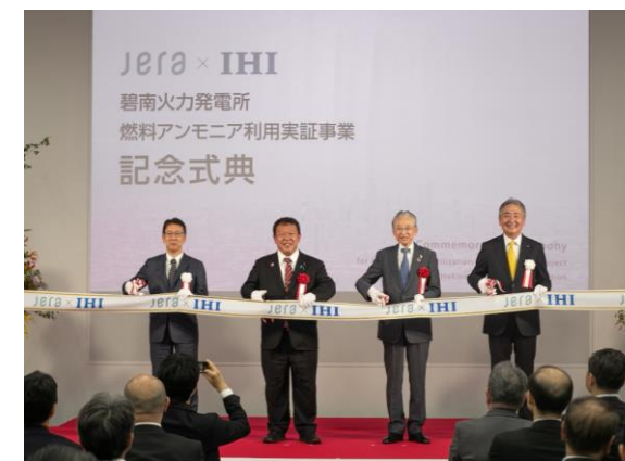
2024年6月1日 碧南火力発電所 燃料アンモニア利用実証事業記念式典の様子