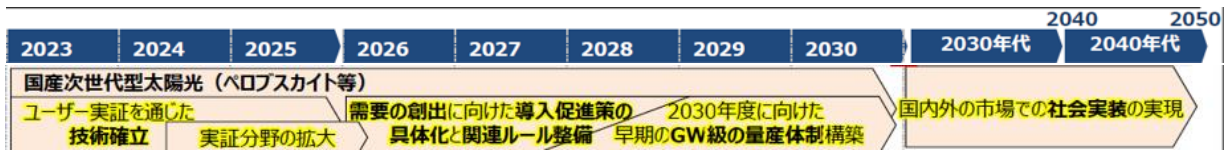
表 2：社会実装スケジュール