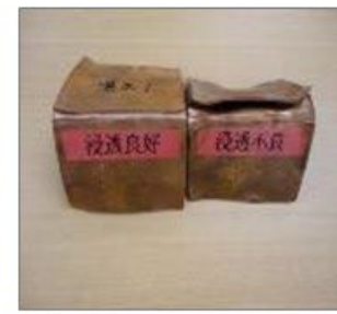
ろうの浸透具合を評価