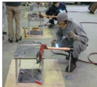
水平配管のろう付け