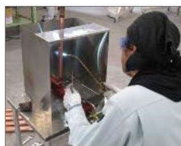
前からのろう付け作業