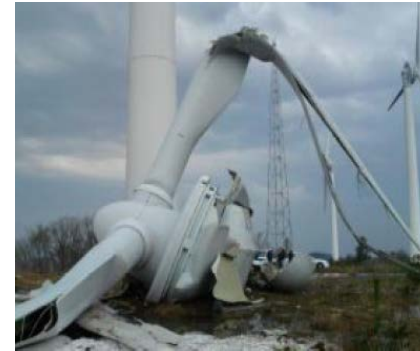
強風により損壊した風力発電設備 (平成25年3月京都府太鼓山)