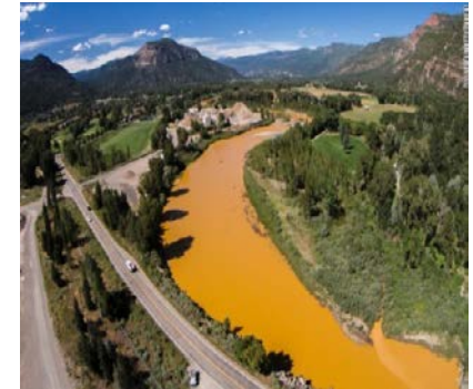
鉱害事故の発生事例 (平成27年8月 米国コロラド州)

風力・太陽光発電事業への新規参入・新設が急増。その後、損壊事故が多発し規制を強化。 ガスシステム改革により、約1,400の小売事業者が新たに保安業務規程を策定し、当省に届出を行うことで、事前相談・審査・指導等の対応が発生。