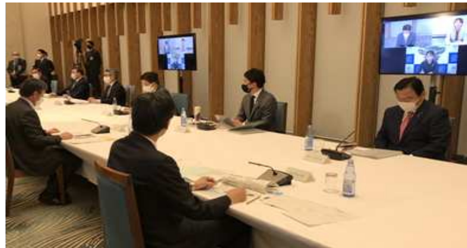
第1回 国・地方脱炭素実現会議（令和2年12月25日）